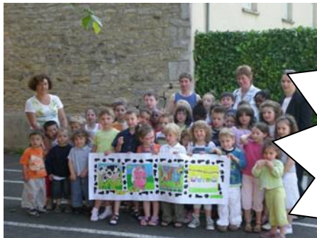
Ecole Maternelle des Petits Chatelets

Chaque classe pourra présenter ses ouvrages. Un jury départagera les classes participantes et décernera différents lots (puzzles pour les maternelles, jeux de sociétés pour les primaires...).